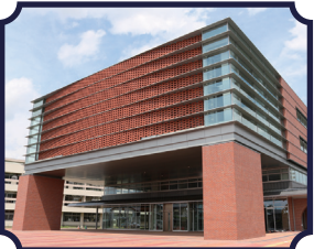
2020年夏に新庁舎オープン 『深谷市役所』

🕒 10-22時 🗓️ 毎週火曜日 🏠 深谷市深谷町 9-12 📍 「深谷駅」より徒歩約10分 ☎️ 048-551-4592