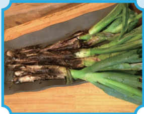
うどん茶屋 三男坊 『泥ねぎの丸焼き』

🕒 11時-14時20分 / 17-20時 🗓️ 毎週木曜日 🏠 深谷市宿根 166-3 📍 「深谷駅」より車で約8分 ☎️ 048-575-1181