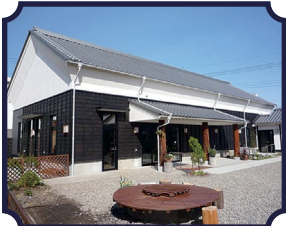
酒蔵の映画館 『深谷シネマ』

🕒 10-22時 🗓️ 毎週火曜日 🏠 深谷市深谷町 9-12 📍 「深谷駅」より徒歩約10分 ☎️ 048-551-4592