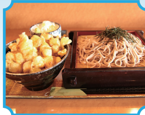
そば蔵 (道の駅おかべ) 『深谷ねぎセット』

🕒 10-19時 🗓️ 毎週日曜日 🏠 深谷市稲荷町 1-19-17 📍 「深谷駅」より徒歩約10分 ☎️ 048-571-0839