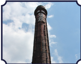
文久3年創業 『瀧澤酒造株式会社』

🕒 8時30分-17時15分 ※木曜のみ19時15分まで(一部の窓口) 🗓️ 土日祝 🏠 深谷市仲町 11-1 📍 「深谷駅」より徒歩約10分 ☎️ 048-571-1211 (代表番号)