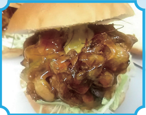
富士屋 『深谷ねぎバーガー』

🕒 11時-14時20分 / 17-20時 🗓️ 毎週木曜日 🏠 深谷市宿根 166-3 📍 「深谷駅」より車で約8分 ☎️ 048-575-1181