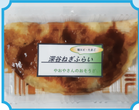
山崎青果店 『深谷ねぎのフライ焼き』

🕒 8-18時 🗓️ 毎週日曜日午後 🏠 深谷市仲町 2-32 📍 「深谷駅」より徒歩約5分 ☎️ 048-571-0636