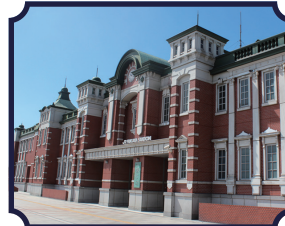
レンガの駅舎 『深谷駅』

🕒 9-17時 🗓️ 年末年始 🏠 深谷市下手計 236 📍 「深谷駅」より車で約10分 ☎️ 048-587-1100 (渋沢栄一記念館)