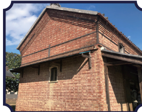
渋沢栄一の従兄 『尾高惇忠生家のレンガ倉庫』

🕒 9-18時 🗓️ 土日祝 🏠 深谷市田所町 9-20 📍 「深谷駅」より徒歩約10分 ☎️ 048-571-0267